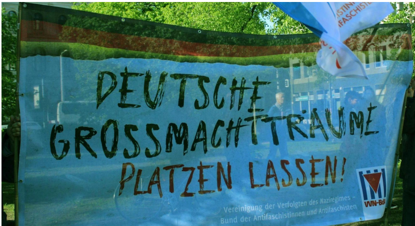
Demonstration "Rheinmetall entwaffnen!" 9.5.2023 Berlin

Die Rüstungsindustrie feiert enorme Umsatz- und Gewinnsteigerungen. 4 Wir aber wollen kein Deutschland als militärische Führungsmacht. Wir wollen, dass unsere Steuern nicht für das Töten, sondern für das Leben ausgegeben werden. Die Menschheit kann sich nicht zuletzt angesichts des Klimawandels eine solche Energie- und Ressourcenverschwendung wie die Rüstung nicht mehr leisten.