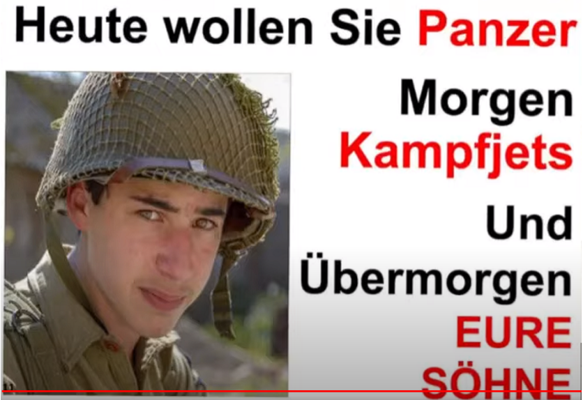
Ein Plakat vom Januar 2023 8

geben". 6 Trotzdem wurden Kampfpanzer geliefert. 7 Es sollen sogar Kampfflugzeuge an die Ukraine geliefert werden. Gleichzeitig geht die Ukraine dazu über, den Krieg nach Russland hineinzutragen. Dass genau das nicht geschieht, war aber am Anfang eine Bedingung der Waffenlieferungen.