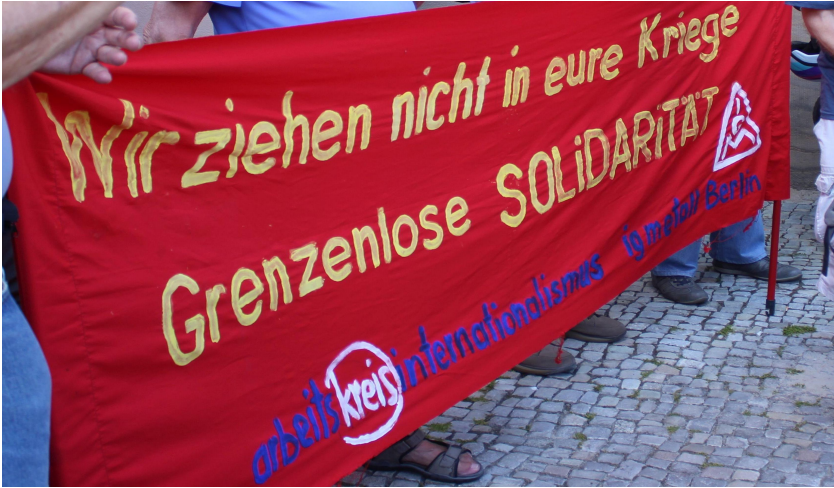
Kundgebung 2.7.2022 August-Bebel-Platz, Berlin

Zusammenarbeit statt Konfrontation — das war eine über Jahrzehnte gewachsene politische Überzeugung mit breiter gesellschaftlicher Unterstützung. Doch was gestern alternativlos war, soll heute nur noch naiv sein. Aber es war nicht ein Zuviel an Kooperation mit Russland, das in diesen Krieg geführt hat, sondern ein eklatanter Mangel an gleichberechtigter Zusammenarbeit aller europäischer Staaten in West und Ost.