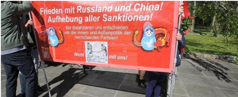
Kundgebung 8.5.2023 Sowjetisches Ehrenmal Treptow, Berlin

Auch die afrikanischen Staaten wurden initiativ. Die NATO schweigt, die USA schweigen. Auch die Bundesrepublik schweigt.