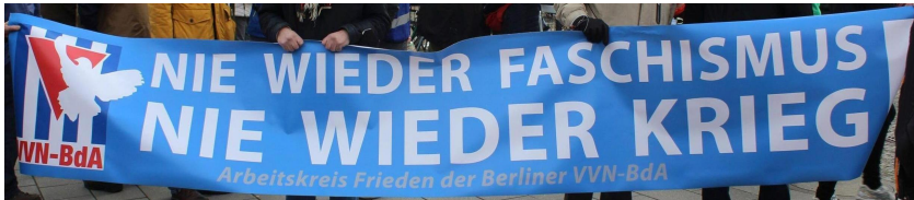
Ostermarsch 8.4.2023 Berlin

Allerdings gibt es in der VVN-BdA, wie in der gesamten Gesellschaft unterschiedliche Auffassungen darum, wie und unter welchen Bedingungen dies zu erreichen ist und mit welchen Konsequenzen. Unterschiedliche Auffassungen haben aber auch viel mit Hintergrundwissen, Blickwinkeln und Erfahrungen zu tun. Für uns als Organisation, die sich aus Mitgliedern unterschiedlicher weltanschaulicher und politischer Positionen zusammensetzt, ist es umso wichtiger, dass es in unseren Publikationen und Veranstaltungen möglich ist, die unterschiedlichen Positionen solidarisch zu diskutieren.